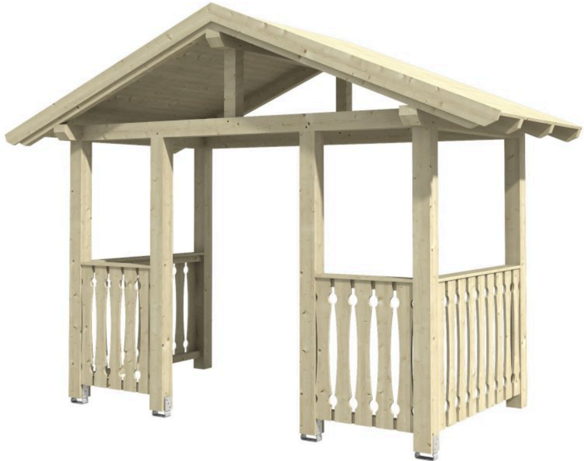
VORDACH STRALSUND 8 360 x 187 cm

Massive Konstruktion aus Konstruktionsvollholz (KVH-Fichte)