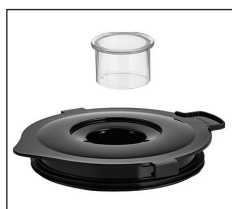
Messbecher-Kappe im Deckel