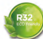
Umwelt- freundliches Kältemittel