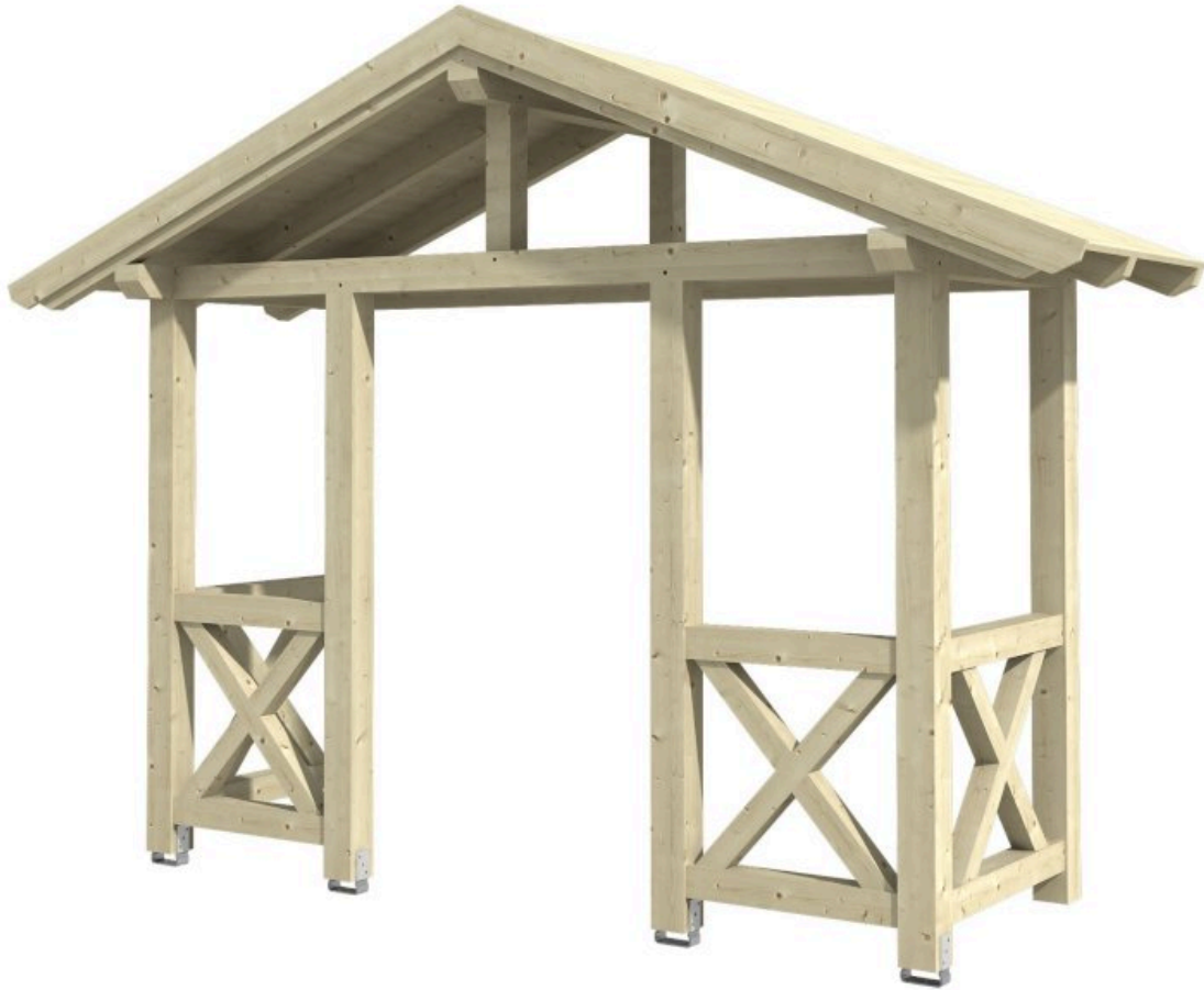
VORDACH STRALSUND 5 360 x 139 cm

Massive Konstruktion aus Konstruktionsvollholz (KVH-Fichte)