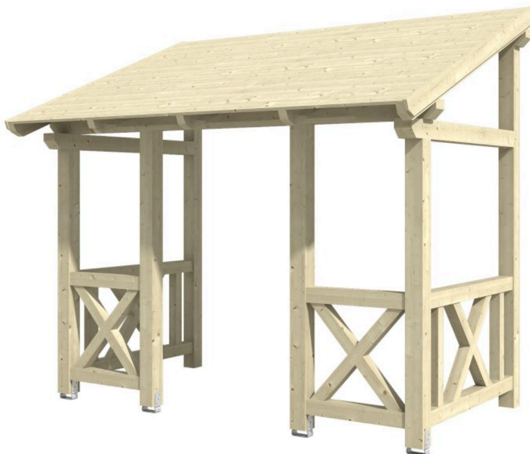
VORDACH PADERBORN 7 336 x 202 cm

Massive Konstruktion aus Konstruktionsvollholz (KVH-Fichte)