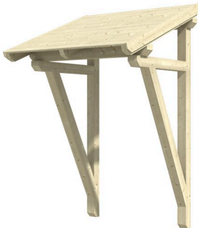
VORDACH POTSDAM 2 176 x 156 cm

Massive Konstruktion aus Konstruktionsvollholz (KVH-Fichte)