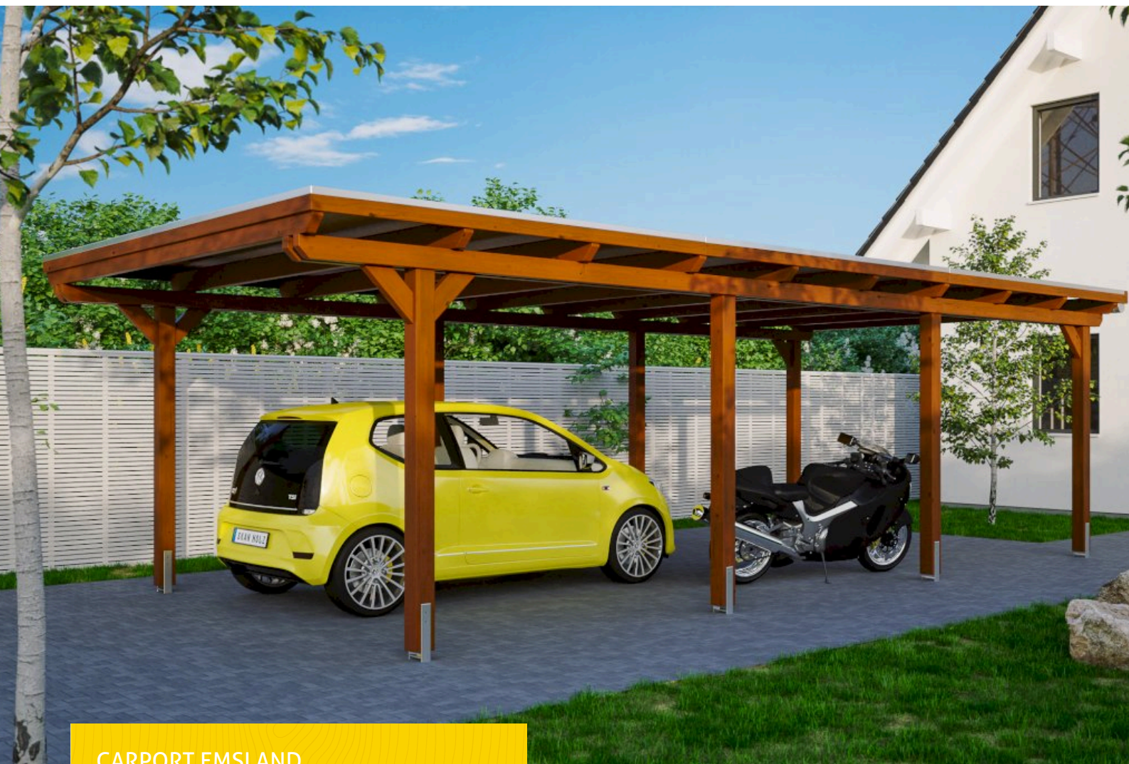
CARPORT EMSLAND 404 x 846 cm