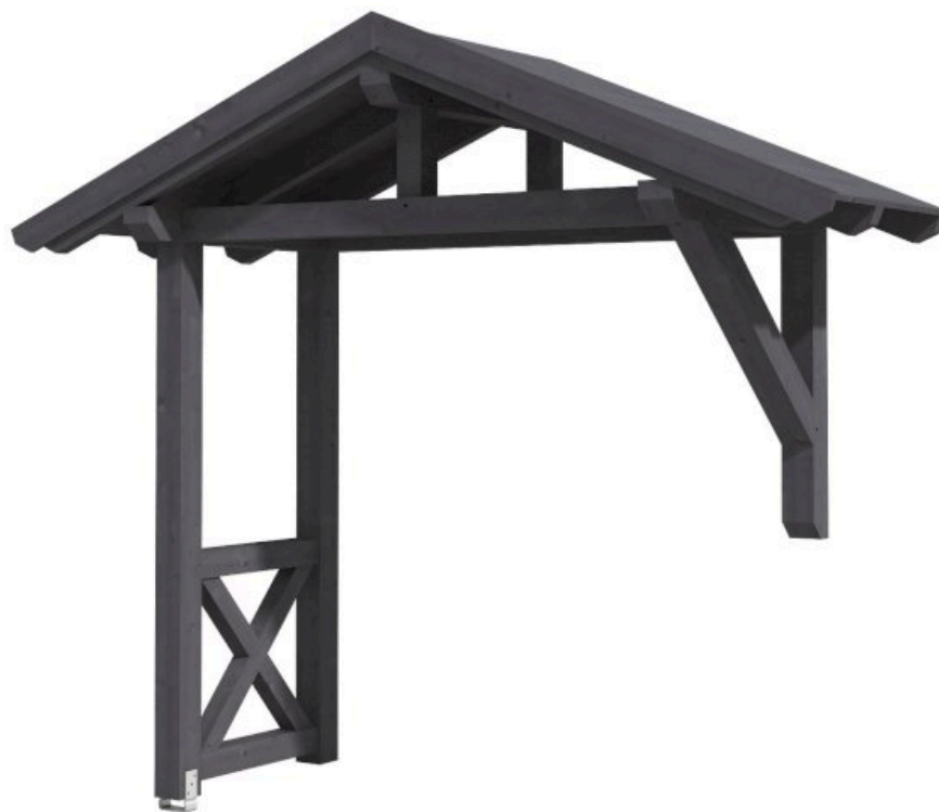
VORDACH STRALSUND 3 289 x 116 cm

Massive Konstruktion aus Konstruktionsvollholz (KVH-Fichte)