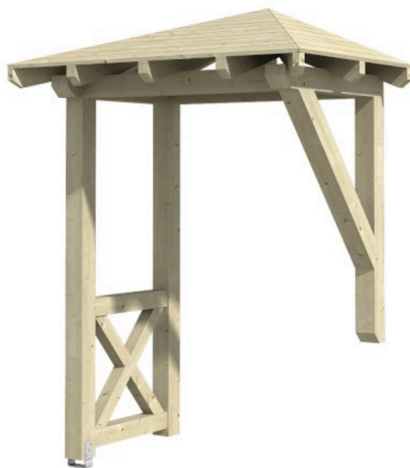
VORDACH WESEL 3 188 x 126 cm

Massive Konstruktion aus Konstruktionsvollholz (KVH-Fichte)