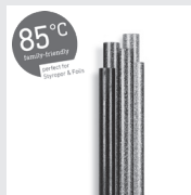
85°C Glitzer Klebesticks 7 mm