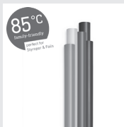
85°C Colour Klebesticks 7 mm