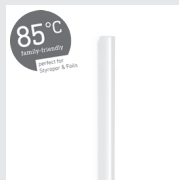
85°C Cristal Klebestick 7 mm