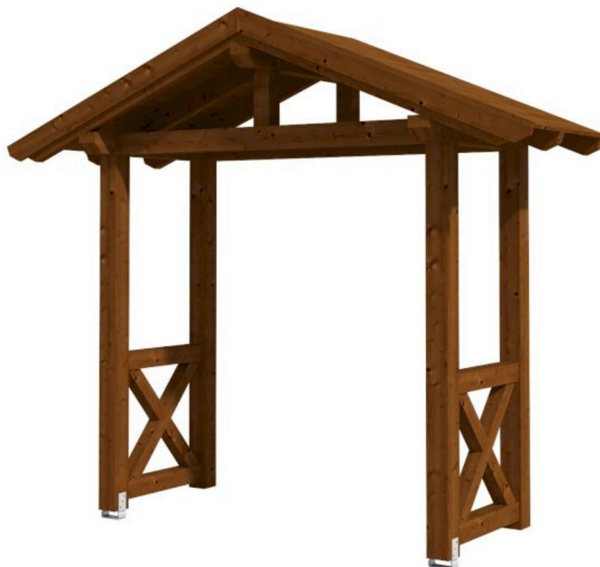
VORDACH STRALSUND 4 289 x 116 cm

Massive Konstruktion aus Konstruktionsvollholz (KVH-Fichte)