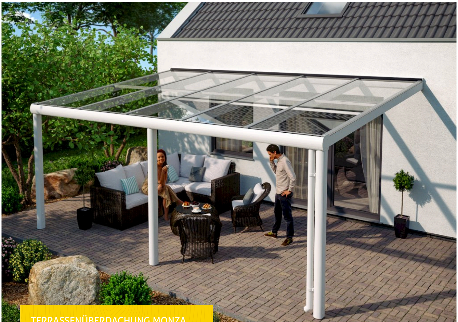
TERRASSENÜBERDACHUNG MONZA 541 x 307 cm

Dacheindeckung aus 10 mm starkem Verbund-Sicherheits-Glas